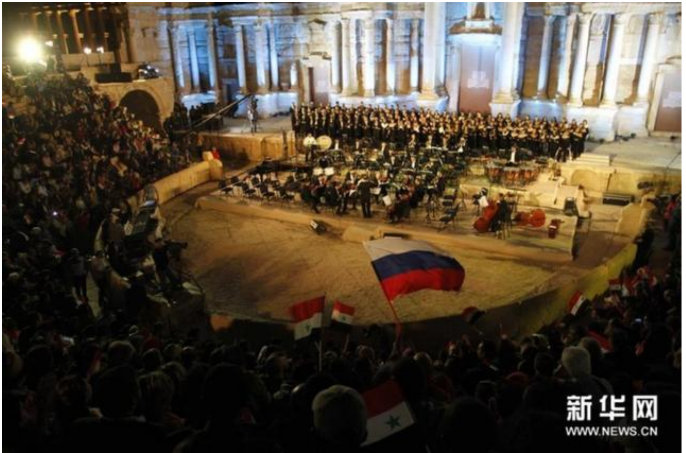
5月，叙利亚与俄罗斯在巴尔米拉举行大型音乐会

据央视新闻，有叙利亚分析人士称，“伊斯兰国”再次攻打巴尔米拉可能是为了扩大周旋范围。