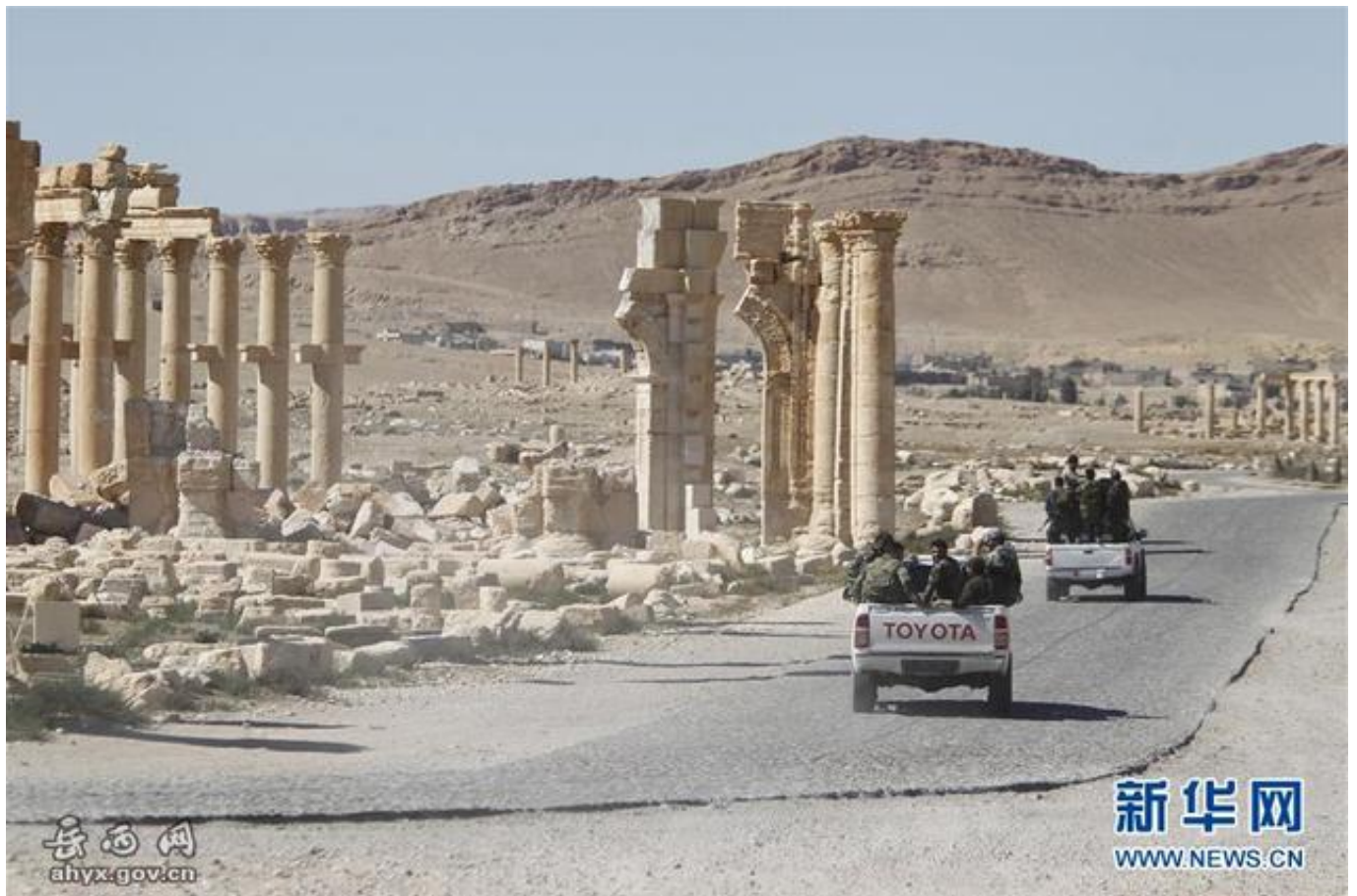
资料图：此前叙利亚政府军在巴尔米拉巡逻

此外，尽管叙利亚政府军集中兵力收复阿勒颇，战事却仍显焦灼；与此同时，有迹象表明极端武装开始转战政府军势力薄弱地区。