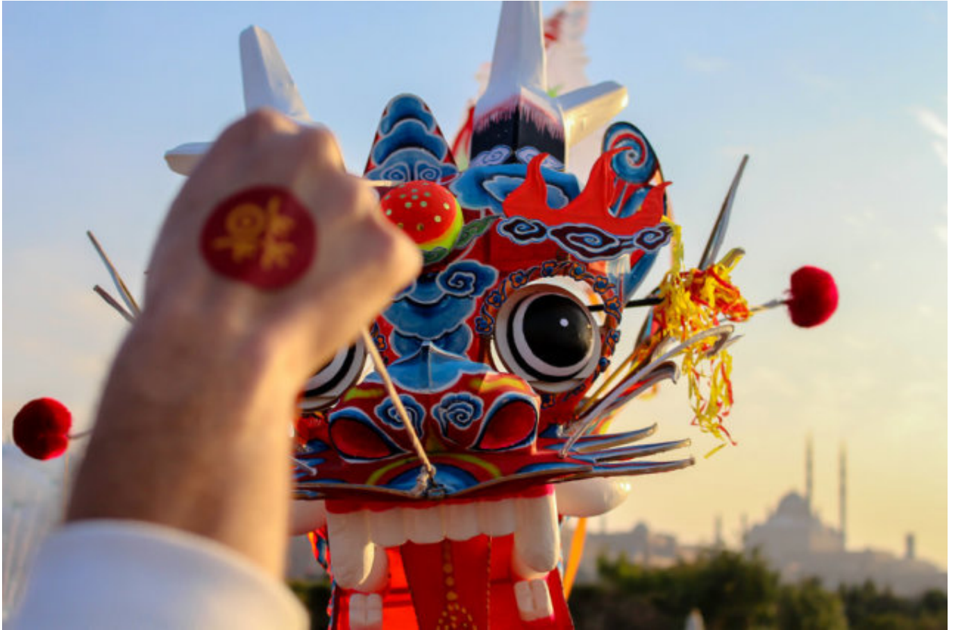
2017年获奖作品欣赏：埃及欢乐春节庙会--放风筝。