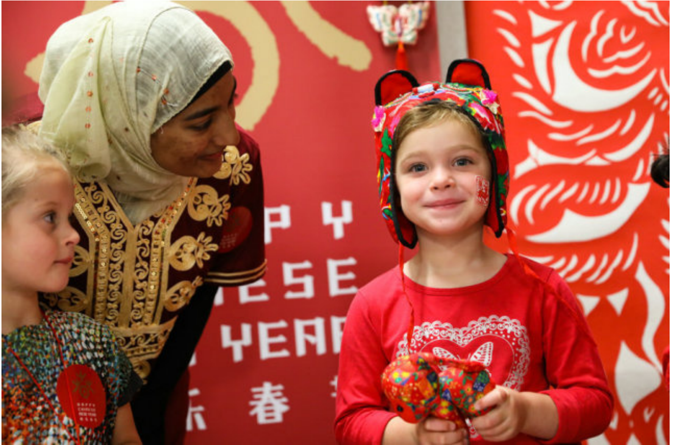
2017年获奖作品欣赏：2017年1月，2017“欢乐春节”非物质文化遗产展演活动走进新西兰惠灵顿。来自中国黑龙江省的民间剪纸、手工布艺、手工面塑三项非遗技艺燃起众多新西兰民众与华人华侨浓浓的“中国乡土情结”。