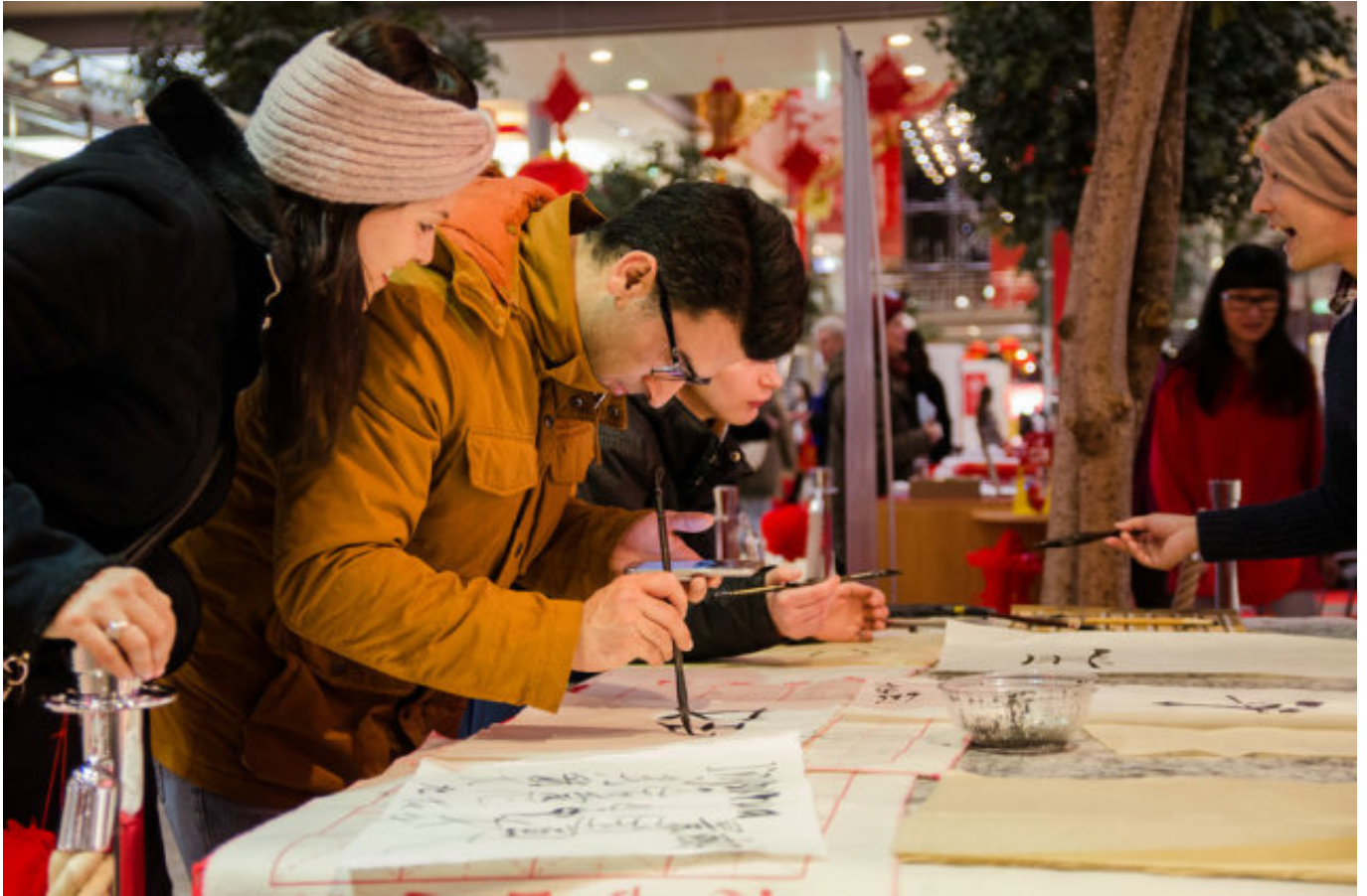
2017年获奖作品欣赏：2017年1月12日至14日，欢乐春节庆祝活动走进德国柏林波茨坦广场。