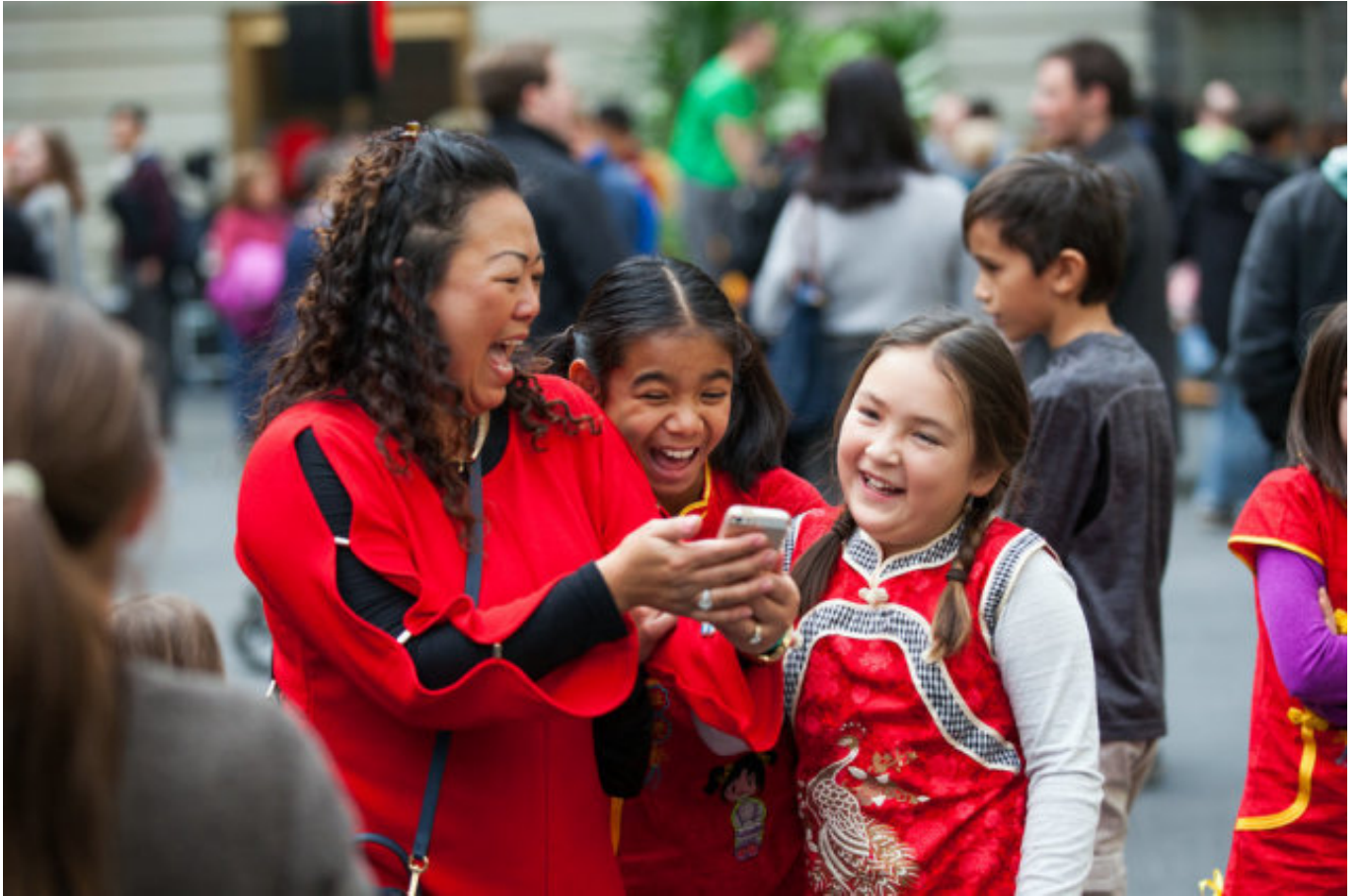
2017年获奖作品欣赏：2017年1月28日，史密森学会美国博物艺术馆举办“中国新年家庭日”活动。